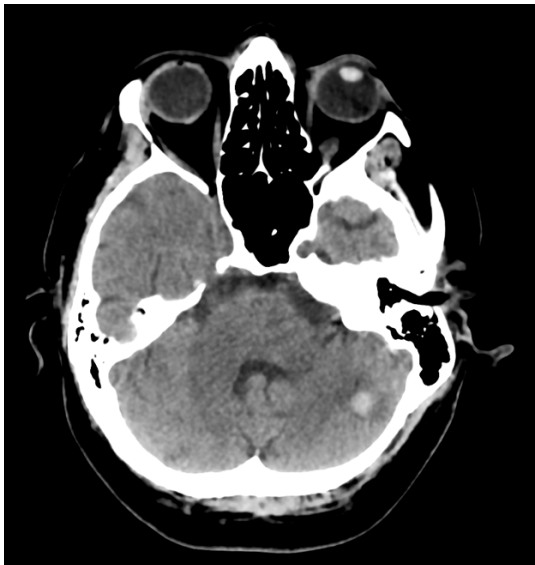
Figura 2. Paciente procura pronto atendimento queixando-se de epistaxe e gengivorragia. TC de crânio evidencia foco hiperatenuante no hemisfério cerebelar esquerdo, compatível com foco hemorrágico, associado a discreto edema perilesional.