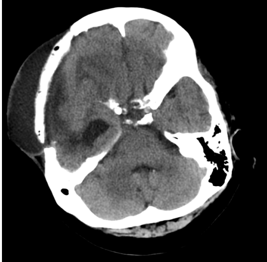
Figura 1. Paciente com antecedente de craniectomia e histórico de queda. TC de crânio observa-se coleção subgaleal formando lâmina líquida, com extensão intracraniana, epidural, com focos gasosos associados.