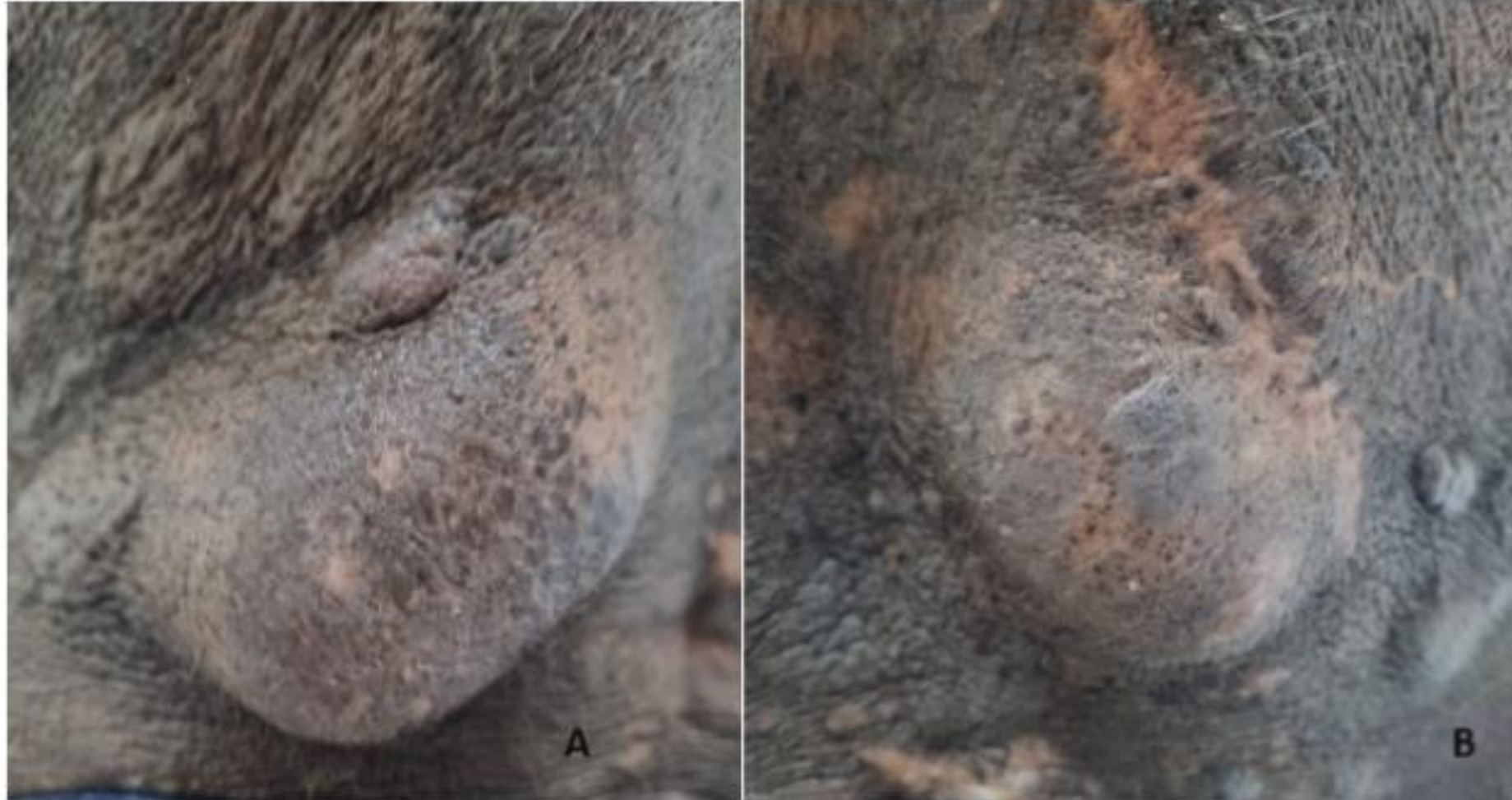
Figura 1, A e B: múltiplas lesões nodulares hiperocrômicas, enegrecidas, de consistência fibroelástica, não aderidas à planos profundos, na região dorsal.