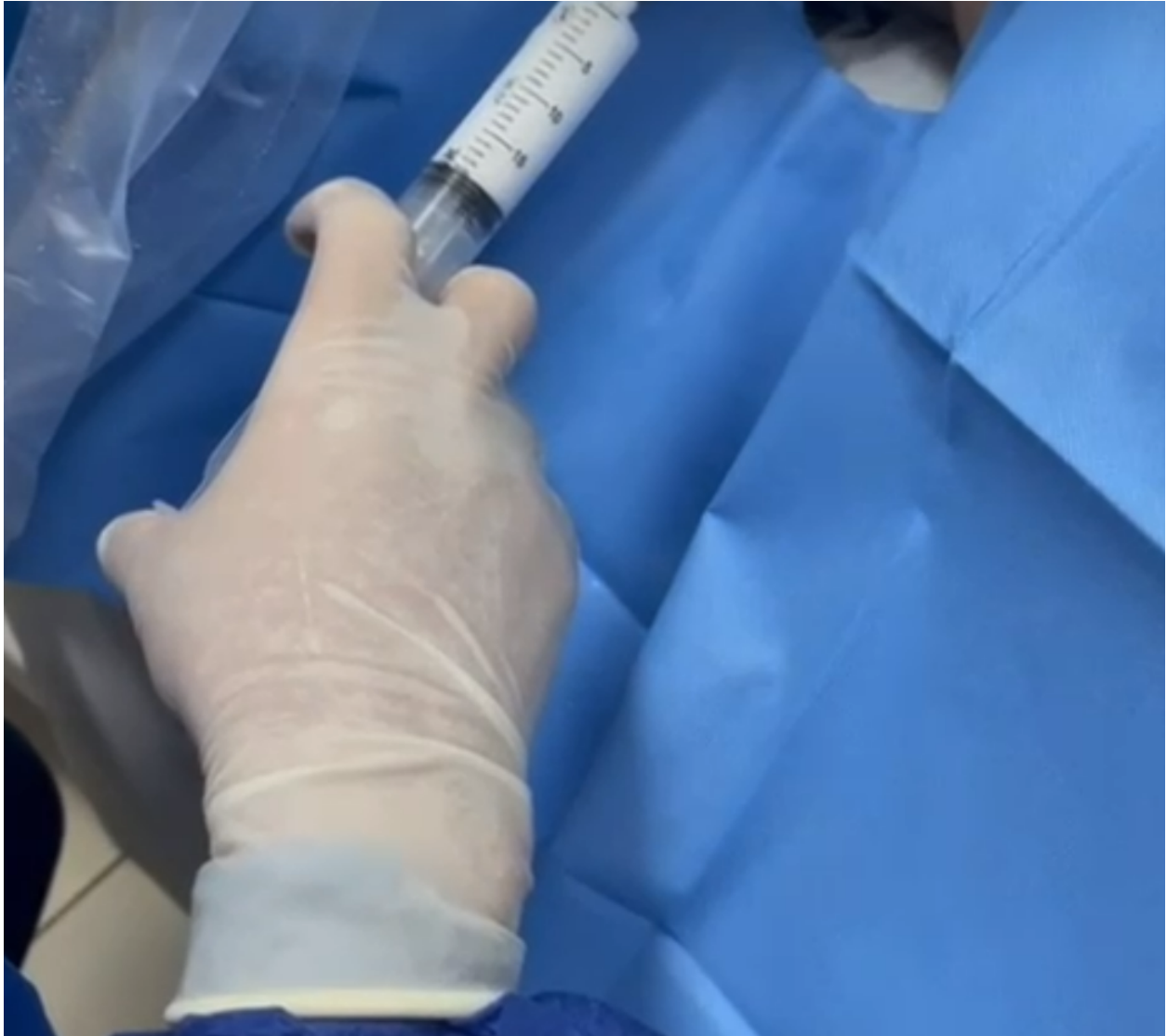
Imagem demonstrando injeção do polidocanol durante o procedimento de escleroterapia.