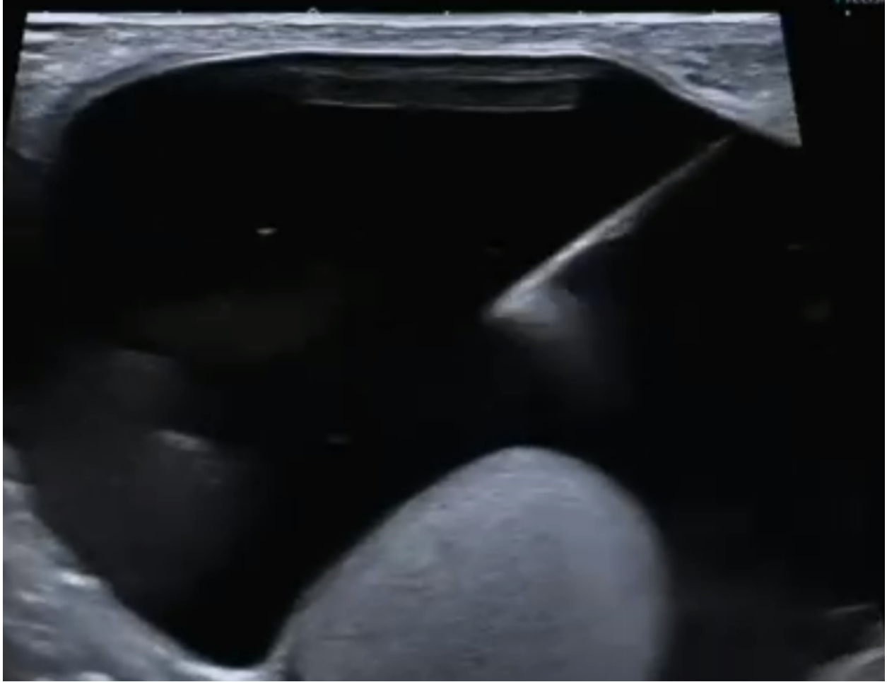
Punção percutânea da bolsa testicular esquerda, com ponta da agulha na hidrocele.