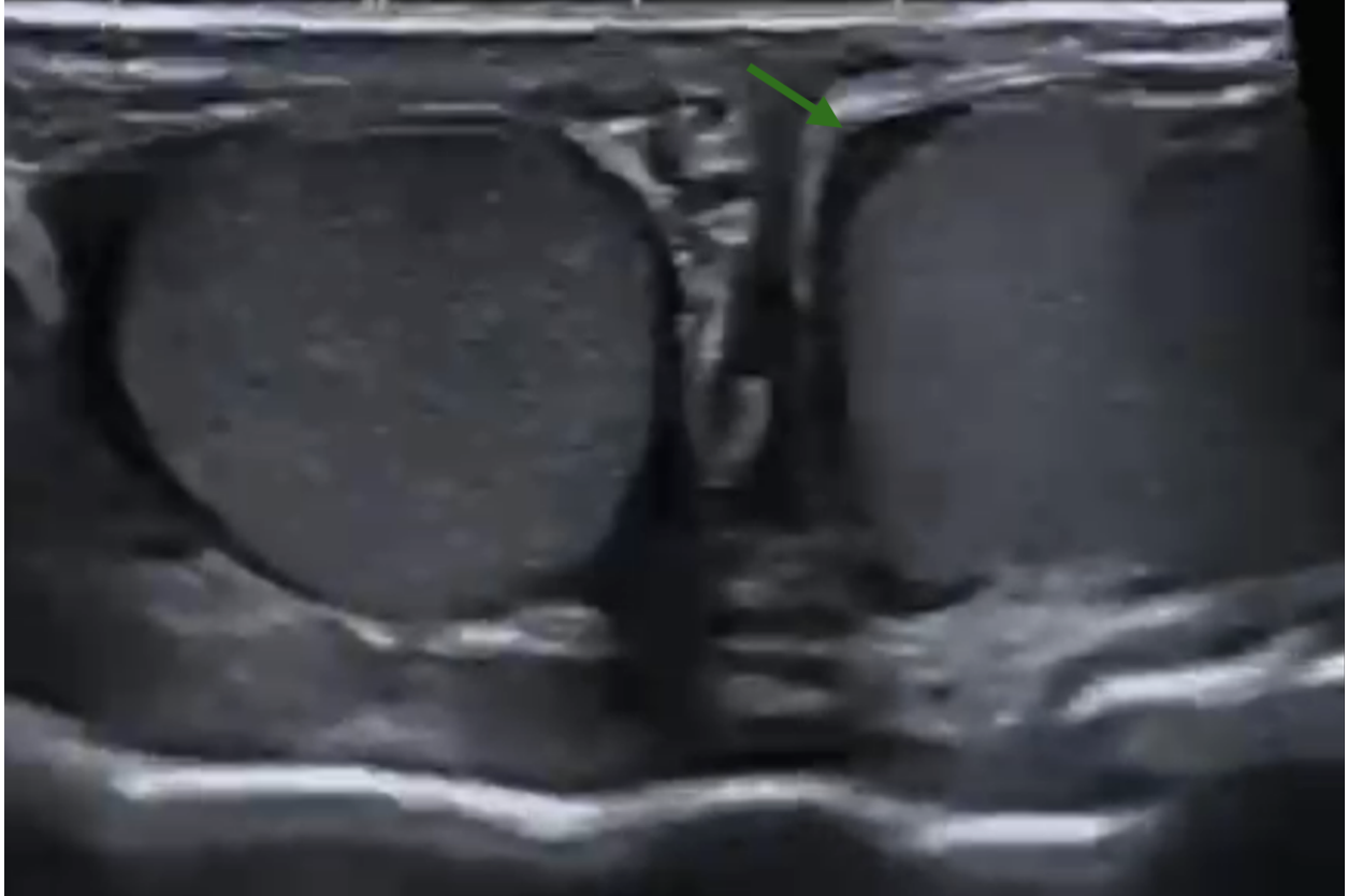
Ultrassonografia de controle realizada 2 semanas após o procedimento ilustrando resolução do quadro.