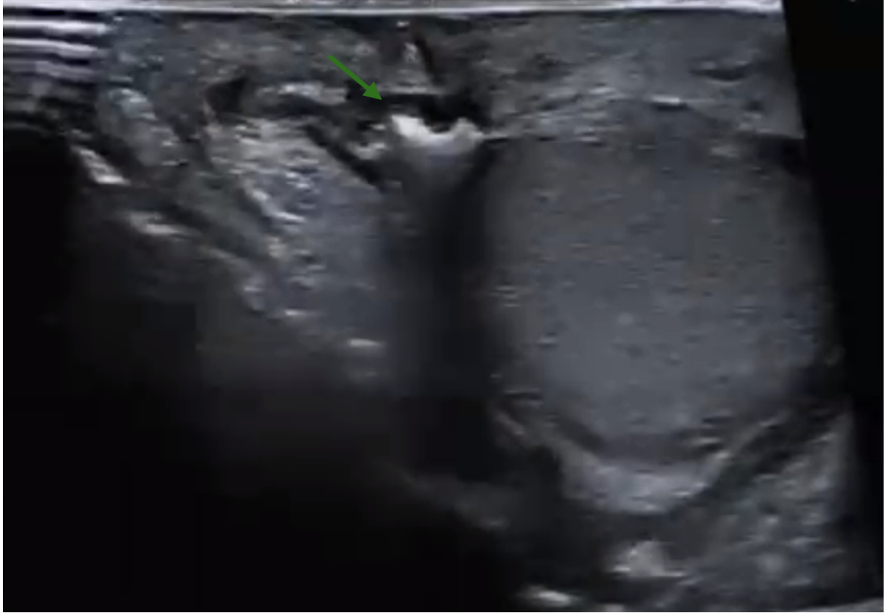
Ultrassonografia da bolsa testicular esquerda demonstrando material (polidocanol) no interior da bolsa e redução quase completa da hidrocele.