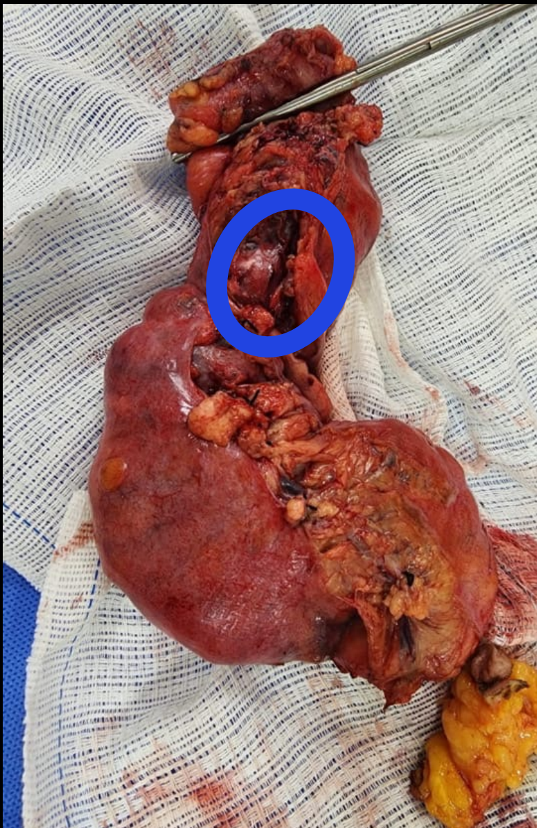
Peça cirúrgica com destaque para região de perfuração.